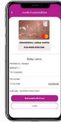
5. ตรวจสอบความถูกต้องอีกครั้งก่อนกด “ยืนยัน”