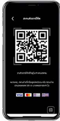
3. สแกน QR Code