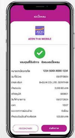
6. ทำรายการสำเร็จ