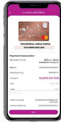
4. เลือกบัตรเครดิตที่ต้องการใช้งาน และตรวจสอบยอดชำระ และกด “ถัดไป”