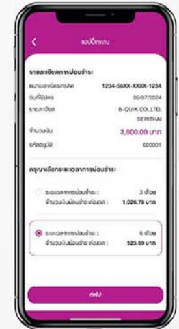
3. เลือก ระยะเวลาการผ่อนชำระ กด "ถัดไป"