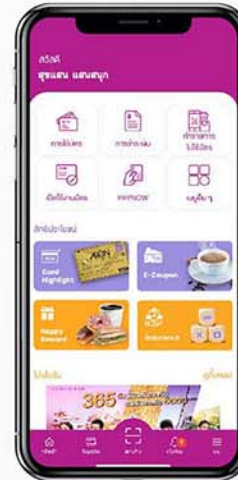
1. เลือก "เมนูอื่นๆ" และเลือก "แอปบีแพลน"