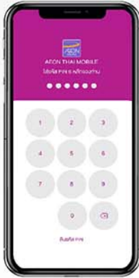
2. กดรหัส PIN 6 หลัก