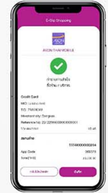
7. ทำรายการสำเร็จหน้าจอแสดงใบเสร็จอิเล็กทรอนิกส์