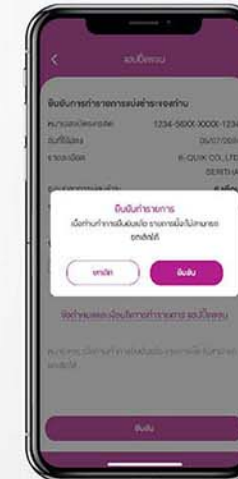
5. กด "ยืนยัน"