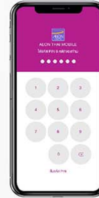
6. ใส่รหัส PIN 6 หลักเพื่อยืนยันการทำรายการ