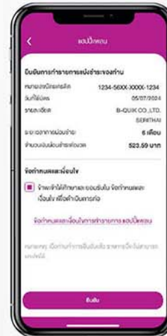
4. กดเพื่อยอมรับเงื่อนไข และ ยืนยัน