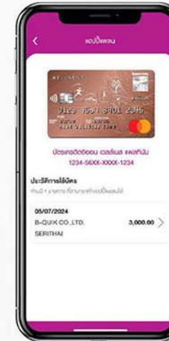
2. เลือก รายการที่ต้องการแบ่งชำระ