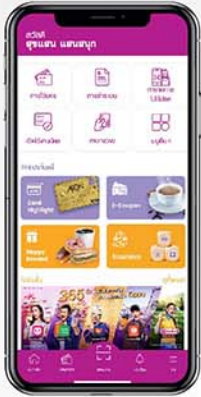
1. เลือกเมนู “สแกนจ่าย”